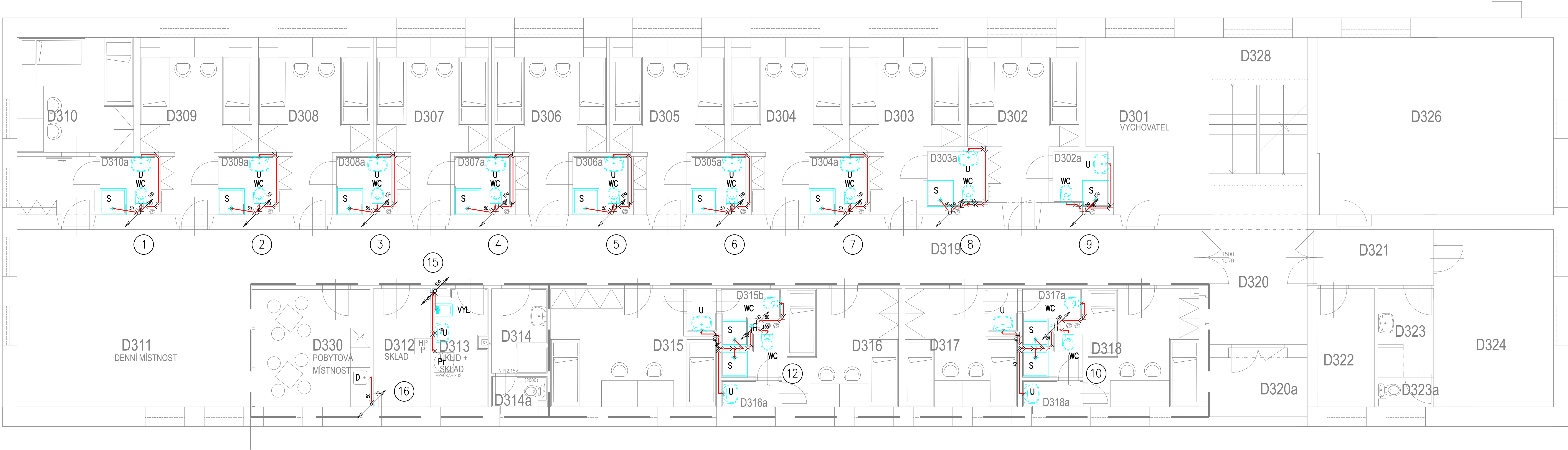
LEGENDA MÍSTNOSTÍ – NOVÝ STAV